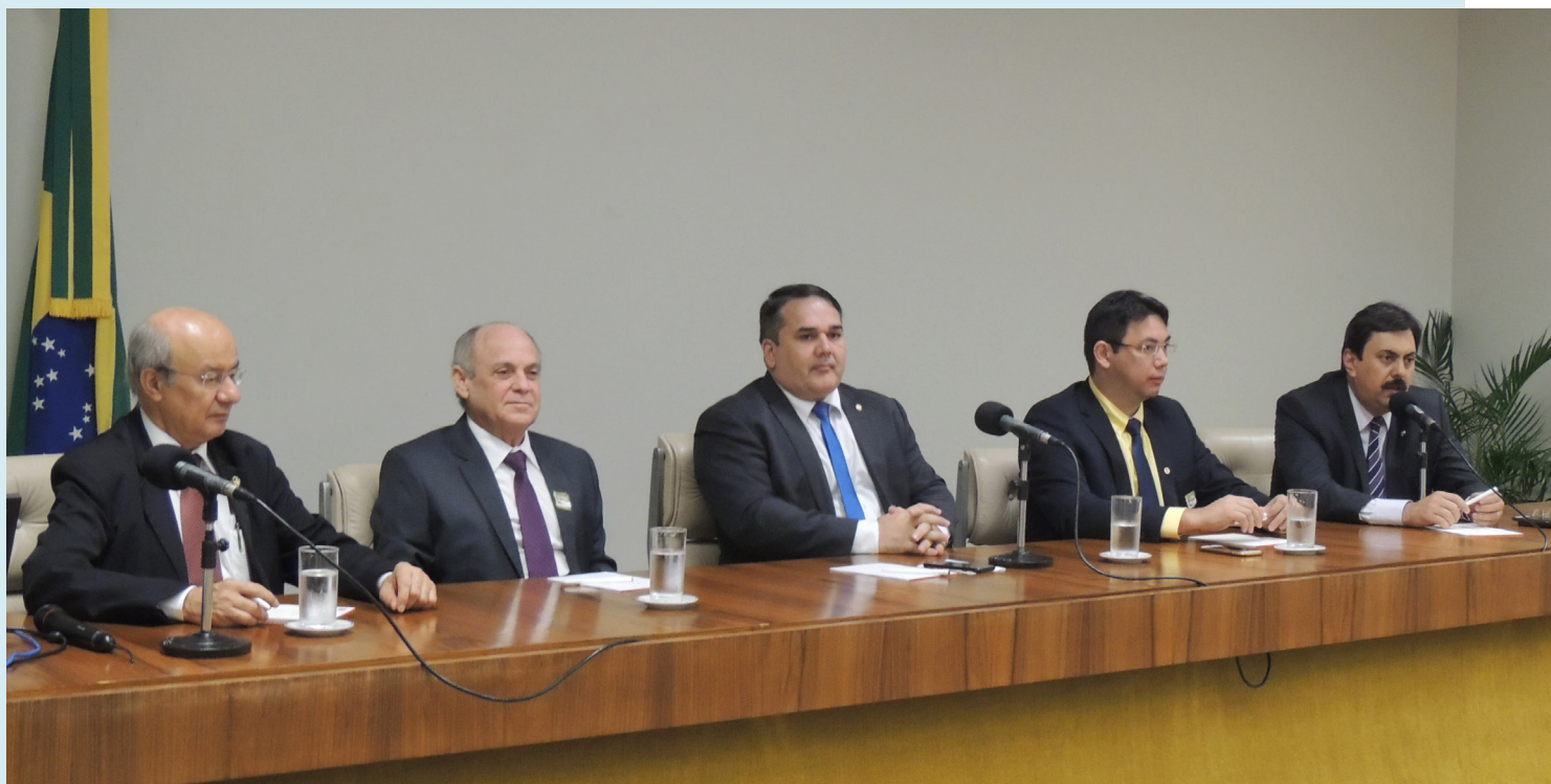
Reunião entre ACM, AMB e bancada do Ceará em Brasília, em março de 2017, foi pioneira e depois ocorreram iniciativas semelhantes de outras associações

O primeiro esforço empreendido pela atual gestão já resultou em uma grande vitória para os magistrados