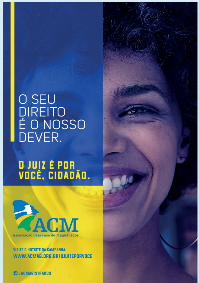
Identidade visual da campanha

Os juizes do Ceará, capitaneados pela ACM, obtiveram avanços expressivos na sessão do Pleno do