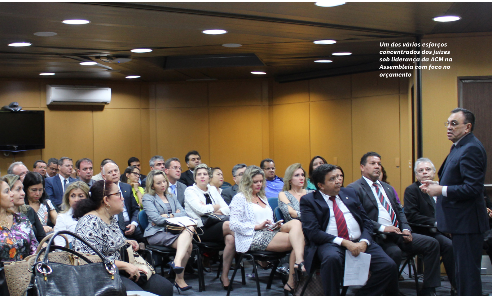
Um dos vários esforços concentrados dos juizes sob liderança da ACM na Assembleia com foco no orçamento